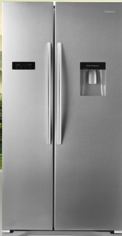
Réfrigérateur américain RS723N4WC1