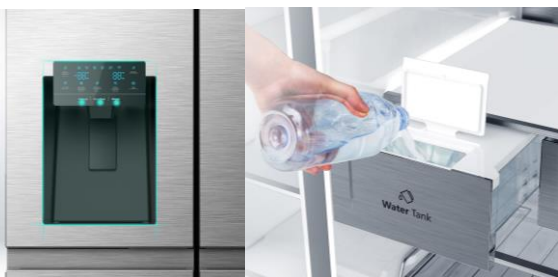
Distributeur d'eau, glaçons et glace pilée en façade

De l'eau fraîche à tout moment de la journée grâce au réservoir non relié à l'arrivée d'eau. Aucune perte d'espace, installation rapide et facile. Il est dorénavant possible de bénéficier des avantages d'un réfrigérateur Américain sans les inconvénients !