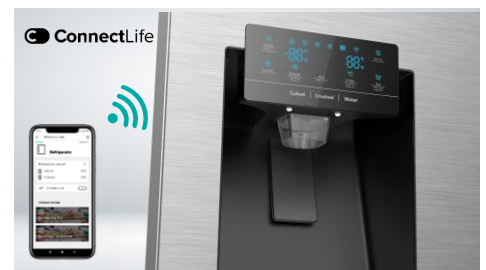
Contrôle à distance (wifi)

La paroi arrière du réfrigérateur recouverte d'acier inoxydable assure un refroidissement rapide et optimal de l'appareil. Les aliments sensibles seront parfaitement conservés, quel que soit leur emplacement. Design contemporain