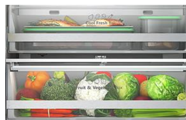
Bac à légumes avec contrôle d'humidité + Compartiment fraîcheur

Grâce au MetalTechCooling, votre réfrigérateur descendra en température plus rapidement, la stabilité de la température sera améliorée et il bénéficiera d'un design plus contemporain.