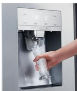
Distributeur d'eau et de glaçons

Le distributeur d'eau et de glaçons dispose d'un réservoir non relié à l'arrivée d'eau. Il est dorénavant possible de bénéficier des avantages d'un réfrigérateur Américain sans les inconvénients et de le placer aisément n'importe où dans la cuisine.