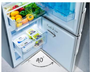
Ouverture à 90°c sans débord

Grâce à l'ouverture de porte sans débord, il est désormais possible d'installer le réfrigérateur directement contre un mur. Il est également possible d'utiliser l'ensemble des tiroirs en toute simplicité.