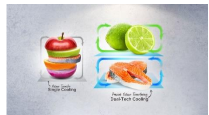
Dual tech cooling

Grâce à ses 39 dB, ce réfrigérateur fait parti des plus silencieux du marché. Il s'intégrera donc parfaitement dans une cuisine ouverte.