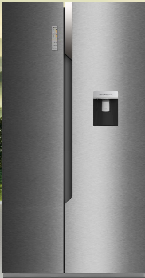
Réfrigérateur américain FSN515W20C