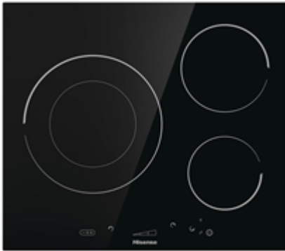
Table de cuisson à induction 734741 I6341C