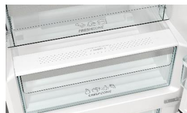
Contrôle d'humidité du bac fruits & légumes + Compartiment fraîcheur

Grâce à ses 38 dB, ce réfrigérateur fait parti des plus silencieux du marché. Il s'intégrera donc parfaitement dans une cuisine ouverte.