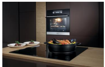
TABLE DE CUISSON À INDUCTION : HISENSE I6337C